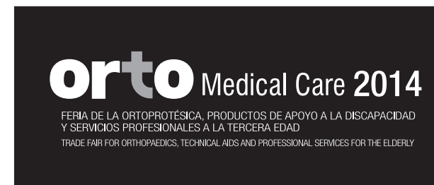
Sobre fondo negro

Se muestran ejemplos de la impresión sobre fondo negro y fondo blanco.